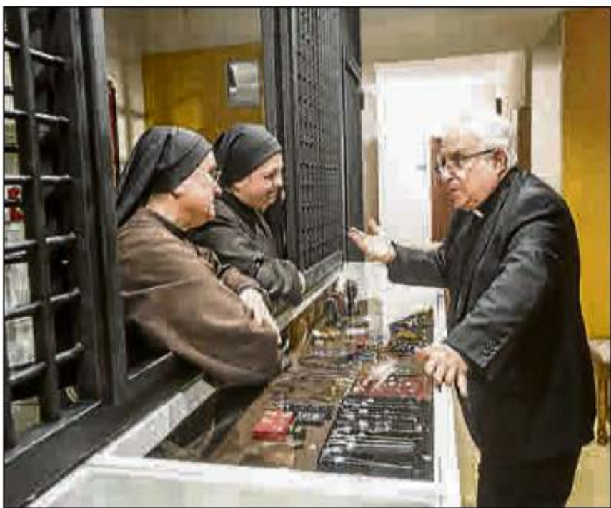
El obispo conversando con dos de las hermanas, ayer. PILAR CORTÉS