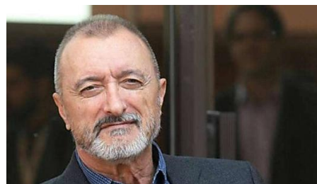
Pérez-Reverte estalla ante el escrache contra Begoña Villacís con un