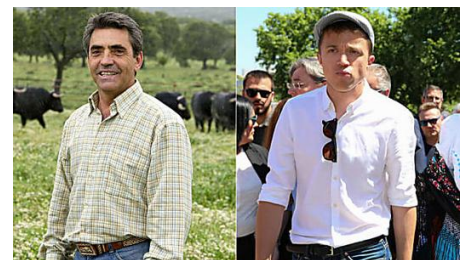
El zasca de Victorino Martín a Íñigo Errejón a cuenta de su "tauromaquia sin