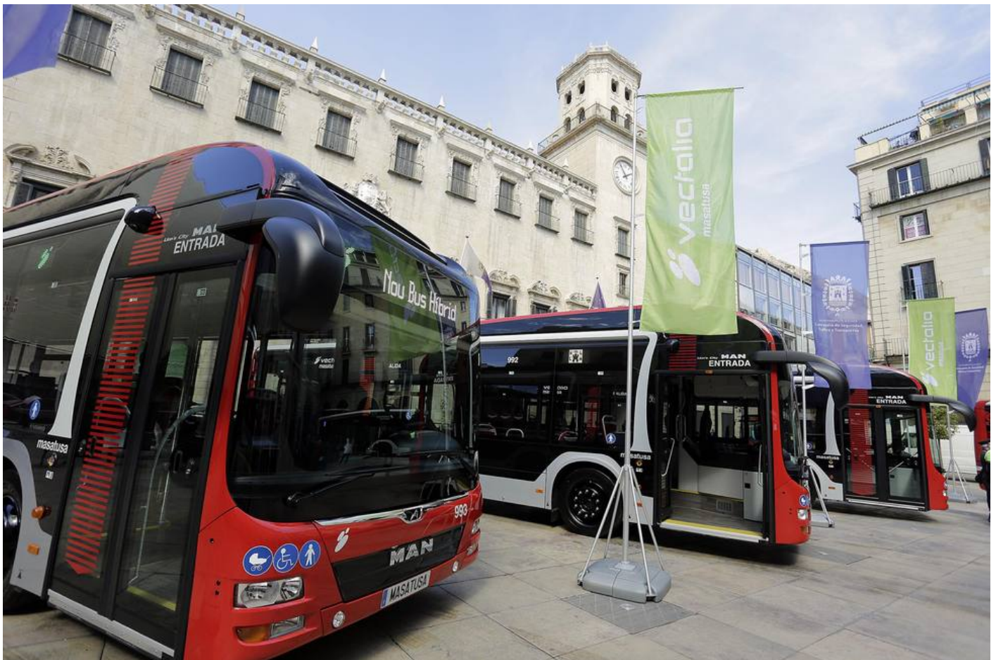
El Ayuntamiento mejora la frecuencia de las líneas 01,02,03,06,07,08,10

El Ayuntamiento mejora frecuencia de líneas 01,02,03,06,07,08,10, amplía la 12 y crea una nueva línea para conectar los polígonos industriales y Fontcalet