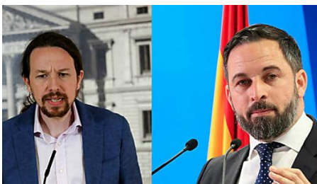
La sorprendente conversación de ascensor entre Pablo Iglesias y Santi