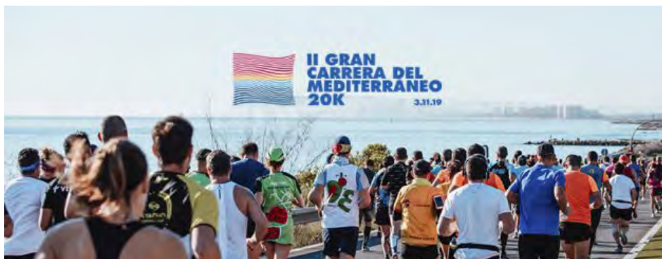
Gran Carrera del Mediterráneo