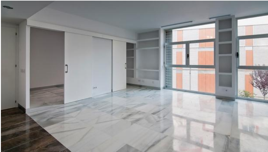
Interior del bloque de Juan de Mata Carriazo

● Se abrirá en febrero y habrá 250 plazas para coches, 32 para motos y 40 para bicicletas